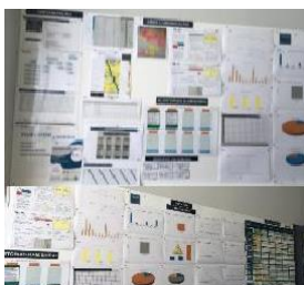
Reuniões de Equipa